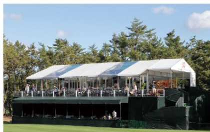
DUNLOP PHOENIX TOURNAMENT 2023

スポーツ競技会・式典・フェスティバル・展示会・野外コンサートなど各種イベント開催に向けた動員分析などのコンサルティング業務から、企画やデザイン・建築設計や運営などの多彩なご提案が可能です。他にも、XRなどのデジタルソリューションはもちろんのこと、テントや備品などのレンタルも手がけることができ、イベント開催業務のあらゆるニーズにお応えいたします。