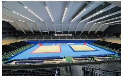
第75回 全日本新体操選手権大会