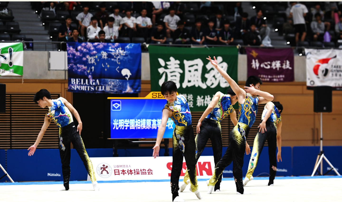
男子団体優勝 光明学園相模原高等学校