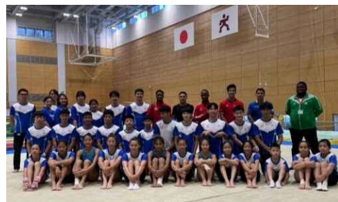
台北・ナイジェリア