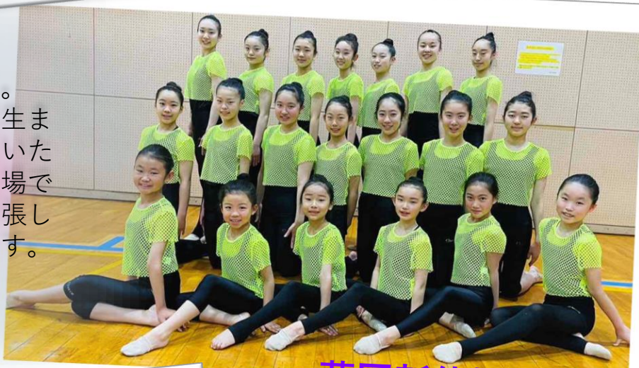
藤岡新体操クラブ

藤岡新体操クラブです。本日は小学生から高校生までの26名で出演させていただきます。このような場で演技させて頂くのは緊張しますが楽しんで踊ります。どうぞご覧ください。