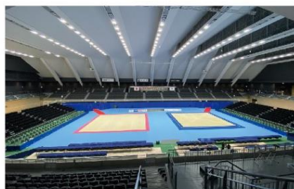
第75回 全日本新体操選手権大会