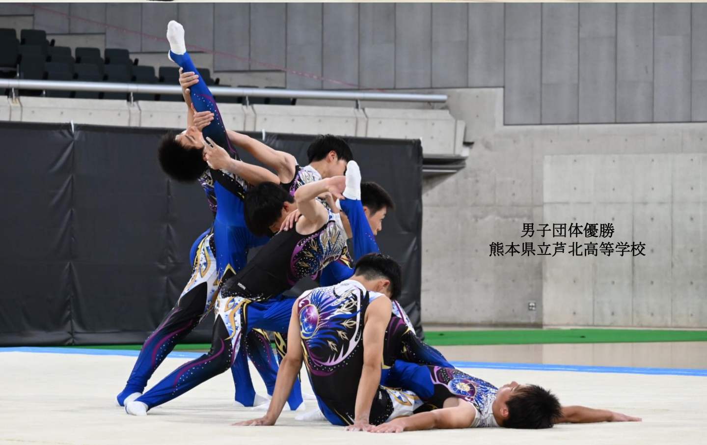
男子団体優勝 熊本県立芦北高等学校