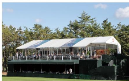
DUNLOP PHOENIX TOURNAMENT 2023

スポーツ競技会・式典・フェスティバル・展示会・野外コンサートなど各種イベント開催に向けた動員分析などのコンサルティング業務から、企画やデザイン・建築設計や運営などの多彩なご提案が可能です。他にも、XRなどのデジタルソリューションはもちろんのこと、テントや備品などのレンタルも手がけることができ、イベント開催業務のあらゆるニーズにお応えいたします。