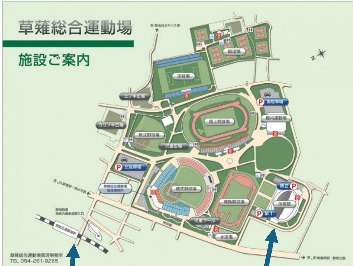
静岡鉄道「県総合運動場」駅